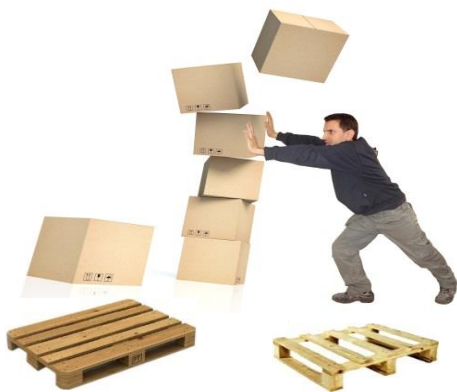
EUR-pall och Halvpall